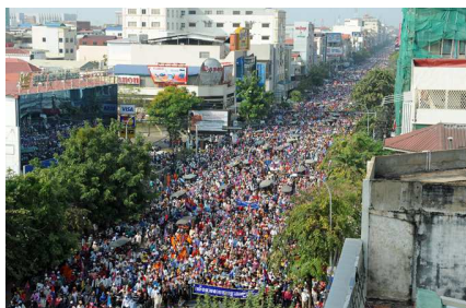
عکسی از راهپیمایی های اعتراضی روزمره در پنوم پنه

در پاسخ به اعتراضات ممتد هزاران کارگر، سرانجام دولت کامبوج تصمیم گرفت که حداقل دستمزد آنان را از 80 دلار به 100 دلار افزایش دهد. اید تصمیم از اول فوریه اجرا خواهد شد.