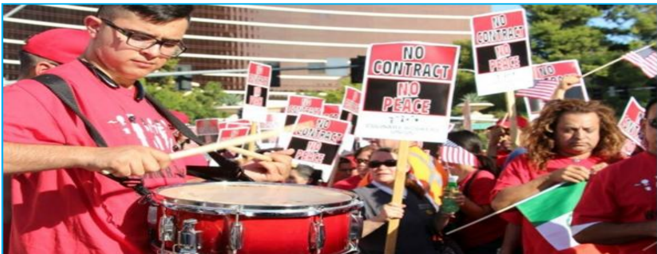
۲۲ اوت ۲۰۱۵: اعتراض کارگران هتل ترامپ برای شرایط کار بهتر