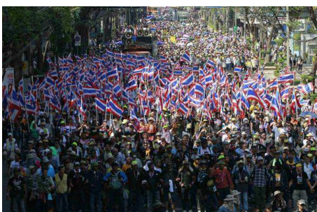
عکسی از تظاهرات روزهای اخیر بانکوک

14 ژانویه روزنامه تایلندی "ملت" اعلام کرد که کارگران بخش بهداشت و درمان تایلند با تصریح خواسته هایشان دولت را به تشدید اعتراضات تهدید کرده اند. بنا به خبر این روزنامه کارگران خواهان آنند که انتخابات آتی، که قرار است روز 2 فوریه برگزار شود، به تعویق افتد، دولت موقت به رهبری شیناواترا باید کنار رود و راه را برای انجام اصلاحات باز بگذارد. کارگران تهدید کرده اند که اگر دولت به این مطالبات پاسخ مساعد ندهد آنها به تشدید تظاهرات برای سرنگونی دولت دست خواهند زد.