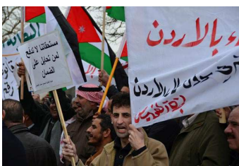
عکسی از یکی از تجمعات کارگران در برابر پارلمان اردن

در سال 2011، کمتر روزی بدون این یا آن اکسیون کارگری طی می شد. در پایان این سال دیده بان جنبش کارگری اردن 829 اعتراض کارگری را ثبت کرده بود و گزارشها حاکی از آنند که تا اواسط سال 2012 نیز 560 اعتراض کارگری به وقوع پیوسته اند. برخی از این اکسیونهای کارگری کوتاه و کم دامنه بودند. برخی شان به سرعت به توافقهائی با مدیریت نائل شدند. اما هستند کارگرانی نیز که سالهاست در اعتراض اند و مطالباتشان را، که در این مدت گاه به مطالبات سیاسی نیز ارتقاء یافته اند، پی می گیرند. رشد اکتیویسم کارگری در اردن در سال 2011 مرهون شجاعت تظاهرکنندگان در کشورهای سراسر منطقه بود و ناشی از این واقعیت که به نظر می رسید حاکمیت تمایلی به سرکوب تظاهرات در این فضای نوین سیاسی ندارد، قوت بیشتری می یافت.