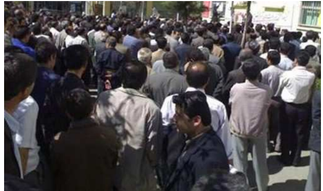
پتروشیمی ایلانم اخراج شده‌اند.

بر اساس این گزارش، سه کارگر دیگر با توجه به تعلیقی بودن احکام صادر شده، حاضر نشدند به رای صادر شده علیه خود اعتراض کنند.