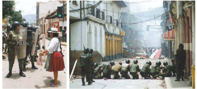
به این شرکت چندملیتی سپرده سود.

این جنبش هم‌چنین در یافتن پاسخ به این سؤال که "مبارزات شکل گرفته بر سر منابع طبیعی... را چگونه می‌توان به سطح عالی‌تری ارتقاء داد؟" سهیم شد. پاسخ این جنبش چنین بود: "از طریق عرضه‌ی آلترناتیو عمومی و اعمال اشکالی از مدیریت جمعی بر منابع". چنان که اسکار اولیورا، یکی از رهبران مبارزه‌ی کوچابامبا خاطر نشان کرده است: "مسئله، سازمان‌دهی کارگران و انسان‌های معمولی است... و هدایت آنان تا آنجا که بتوانند ثروت مشترک و مالکیت جمعی‌شان را با دست‌های خودشان کنترل کنند و به کار گیرند. بدیل واقعی در برابر خصوصی سازی؟؟؟ ثروت توسط خود طبقات زحمتکش است..."