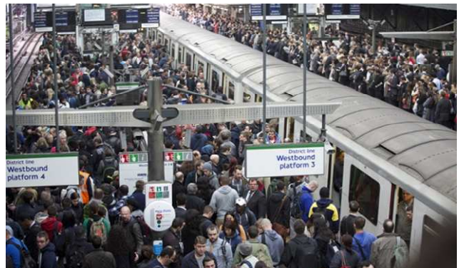
ایستگاهی در لندن در جریان دومین اعتصاب کارگران مترو، در روزهای پایانی آوریل ۲۰۱۴

بیش از ۵۰۰ کارگر بخش صنعت داخلی شرکت کشت و صنعت نیشکر هفت تپه بار دیگر تجمع‌های اعتراضی خود را در مقابل دفتر امور اداری این واحد اداری از سر گرفتند.