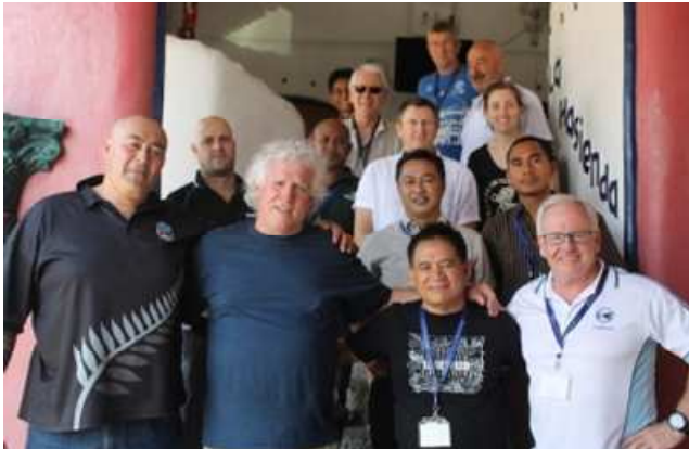
رهبران اتحادیه‌های دریایی ۴ کشور منطقه‌ی آسیا-اقیانوسیه پس از نيل به توافق برای ایجاد فدراسیون بین‌المللی ترابری دریایی

اتحادیه‌های حمل و نقل اندونزی، استرالیا، زلاندنو و پاپوا گینه‌ی نو، در مورد ایجاد یک فدراسیون منطقه‌ای، فدراسیون بین‌المللی ترابری دریایی، به موافقت رسیدند.