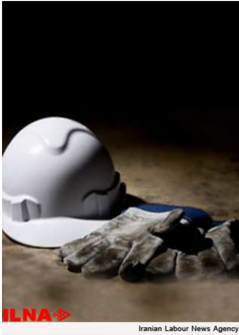
Iranian Labour News Agency

«واحد مرکزی خبر» چهارشنبه ۱۶ مهرماه می‌نویسد: