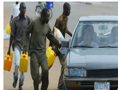
فروش نفت در «بازار سیاه» در جریان یکی از اعتصابات قبلی

او می‌افزاید: "توقف استخراج کار بسیار دشواری است، و اگر این کار صورت گیرد، یک هفته طول می‌کشد تا کار استخراج دوباره از سر گرفته شود. آن‌ها هرگز دست به چنین کاری نخواهند زد. این آخرین چیزی است که ممکن است کسی بخواهد.