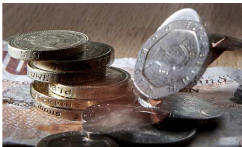
انتظار می‌رود که به زودی نرخ تورم به زیر ۱ درصد برسد

آمار انتشار یافته نشان‌دهنده‌ی نرخ بیکاری شش درصد است. بنابراین نرخ بیکاری در دوره‌ی اوت تا اکتبر سال جاری ثابت باقی مانده است. این در حالی است که انتظار می‌رفت نرخ بیکاری به ۵/۹ درصد کاهش یابد.