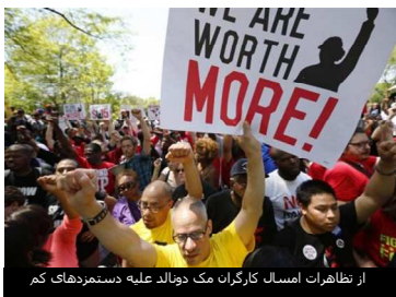
از تظاهرات اسمال کارگران مک دونالد علیه دستمزدهای کم

کوشش برای احیای اتحادیه‌ها بر زمینه‌ای انجام گرفته است که قانون کار همچنان با اتحادیه‌پذیری خصومت می‌ورزد و کارفرمایی که این قانون به خودی خود ضعیف را هم نقض می‌کنند، با هیچ مجازات بامعنایی مواجه نیستند.