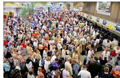
مهاجرت: صحنه‌ی مکررتر جهان بیش رو

یونی یک اتحادیه‌ی جهانی برای بخش خدمات است و ۲۰ میلیون کارورز را در بیشتر از ۱۰۰ کشور نمایندگی می‌کند. مدیرکل این اتحادیه، فیلیپ جینینگز، در سخنرانی خود در چهارمین کنگره‌ی آن که در هفته‌ی گذشته در کیپ تاون برگزار شد، گفت: «بگذارید این گزارش هشدار باشد. یک سونامی تکنولوژیک در راه است که می‌تواند بسیاری از گمانه‌های پیشین در باره‌ی آینده را بشوید و با خود ببرد.» او افزود: «بازار کار، اتحادیه‌های کارگری، و در واقع تمام دنیا باید دست به نوسازی زنند و با این چالشی که در پیش است، درگیر شوند. این چالش به خودی خود رفع نمی‌شود و پای همه‌ی ما را به میان می‌کشد. ما باید شاهد ایجاد فرصت‌های شغلی در ابعاد بزرگ و سرمایه‌گذاری‌های عظیم در آموزش و مهارت باشیم.»