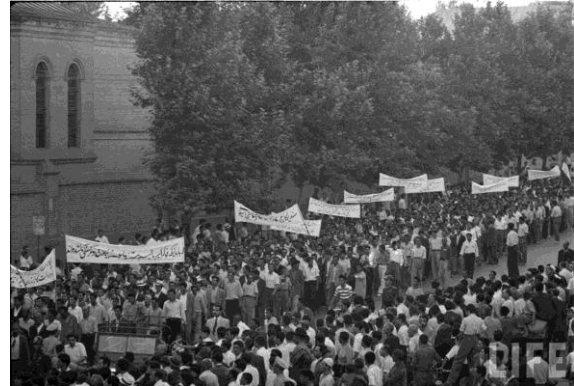
رضا روستا راه توده