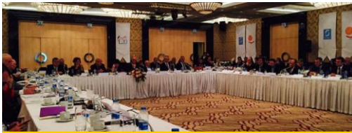
کنفرانس وزرای دارایی کشورهای گروه ۲۰ در استانبول

کنفدراسیون بین‌المللی اتحادیه‌های کارگری (ITUC)، ۹ فوریه‌ی ۲۰۱۵