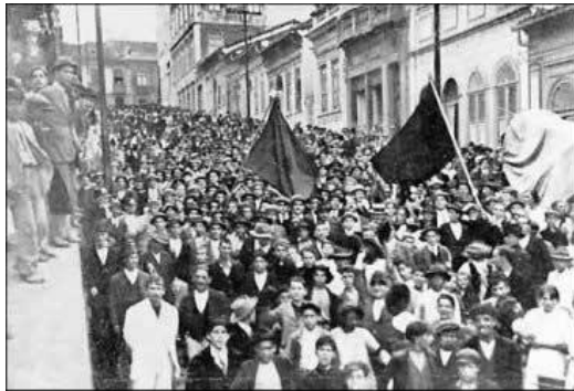
از تجمعات اتحادیه‌های کارگری برزیل در «نخستین دوره دموکراسی»