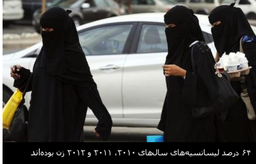
۶۴ درصد لیسانس‌های سال‌های ۲۰۱۰، ۲۰۱۱ و ۲۰۱۲ زن بوده‌اند

طبق آمار دفتر مرکزی آمار و اطلاعات عربستان سعودی، زنان در این کشور، علیرغم سهم ۵۱ درصدی‌شان از فارغ‌التحصیلان، فقط ۱۳ درصد مشاغل خصوصی و دولتی را در اختیار دارند.