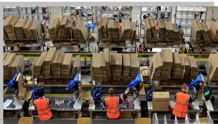
شرکت آمازون در سال ۲۰۱۵ هشتاد هزار کارگر فصلی را استخدام

در خبر کوتاه زیر از استخدام ۹۵ هزار کارگر فقط برای "فصل تعطیلات" گفته شده است. صدها هزار استخدام در فصل تعطیلات، یعنی صدها هزار بکار پس از خاتمه تعطیلات.