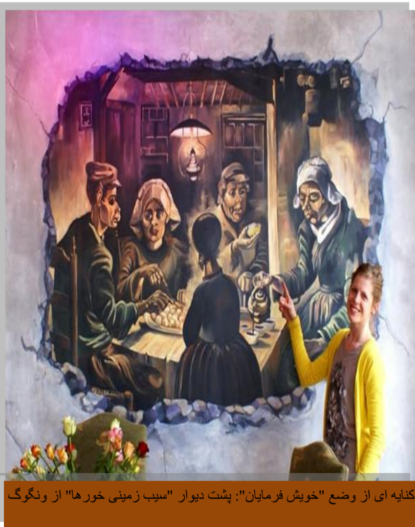
کنایه ای از وضع "خویش فرمایان": پشت دیوار "سیب زمینی خورها" از ونگوگ

طبعاً همچنین وظیفه نظارت بر استمرار این مشاغل در میان است. در این مورد ما برنامه داریم که اعضا و کادرهایمان