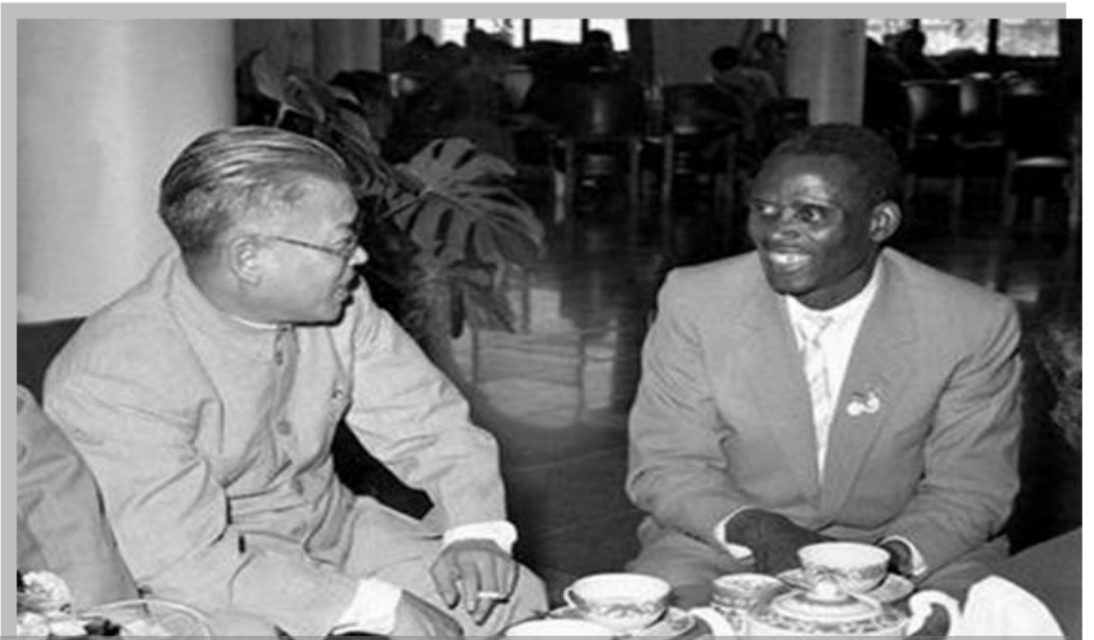
پکن، سپتامبر ۱۹۵۹: دیدار مایکل ایمودو، پرزیدنت وقت کنگره کار نیجریه با دبیرکل فدراسیون سراسری اتحادیه های کارگری چین

جنبشهای اتحادیه ای هم چنین توانسته اند نقش سکوی جهش برای اعضای خود در رسیدن به پستهای سیاسی از قبیل کمیسیونر، قانونگذار، و فرماندار را بازی کنند. اسناد مارکسیستی هم حکایت از آن دارند که اتحادیه ها می توانند نقش سازمانهایی برای کارگران در جریان تصرف مالکیت کارخانه ها و تولیدات از دست سرمایه داری داشته باشند. از سوی دیگر بسیاری از عاشقان دموکراسی در سراسر جهان از خبرهایی از اوندو، اِدو، و اکییتی خوشنود شده اند که اقدامات قضایی باعث بازگشت فرمانداران این ایالات به پست شان گردیده است. در این پرونده ها کنترل جوامع مدنی باعث شد که مواد لازم را بعنوان ورودی برای تولید به سیستم قضایی بفرستند تا دادگاهها بتوانند احکام مورد نظر را جاری نمایند. در این شرایط جامعه مدنی به مثابه تنها