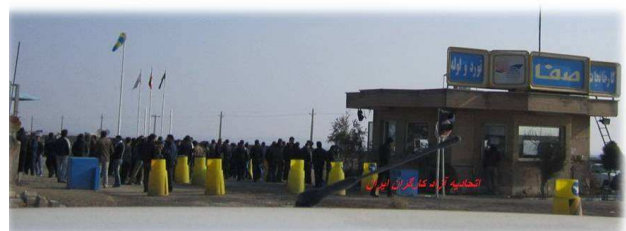
اتحادیه آزاد کارگران ایران :

کارگران لوله و نورد صفا بار دیگر دست به اعتصاب زدند.