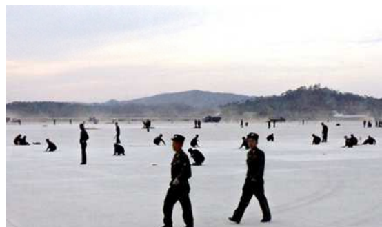
سرباز-کارگران در حال ساختن فرودگاه بین‌المللی سونان

فرودگاه جدید پیونگ یانگ آخرین «کارزار سرعت» در کره‌ی شمالی است. هدف این کارزار پایان دادن به پروژه‌های دارای اولویت بالا در مدت زمان‌های بی سابقه است.