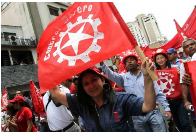
ونزوئلا: "کنترل کارگری"

مدیریت آنها شدند. تعداد کمی از کارخانه‌ها دست به ابتکار «مدیریت مشترک» زدند. برخی‌هاشان هم مالکیت کارخانه را به نسبت ۵۱ درصد به ۴۹ درصد بین دولت و تعاونی‌های کارگری تقسیم کردند. سازمان‌های کارگری مختلفی خواهان مالکیت کامل دولتی بر کارخانه‌ها همراه با کنترل کارگران بر آنها شده‌اند. استدلال آنها این است که این کار مانع از تبدیل تعاونی‌های کارگری به نوع دیگری از «سرمایه‌داری جمعی» خواهد شد. میزان واقعی کنترلی که کارگران بر سازمان کار و مدیریت تولید دارند، از این تا آن کارخانه متفاوت است. بوروکراسی هم عموماً در برابر کنترل واقعی کارگران بر امور مقاومت نشان می‌دهد.