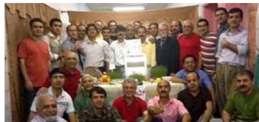
نوروز 1394 زندان گوهر دشت

شعری از ابوالقاسم لاهوتی، تقدیم به همه مبارزان جنبش کارگری که در این شرایط سخت به قیمت جان و زندگی خود در برابر حکومت ضد کارگری جمهوری اسلامی ایران استوار و مقاوم ایستاده اند و مبارزه را ادامه می دهند.