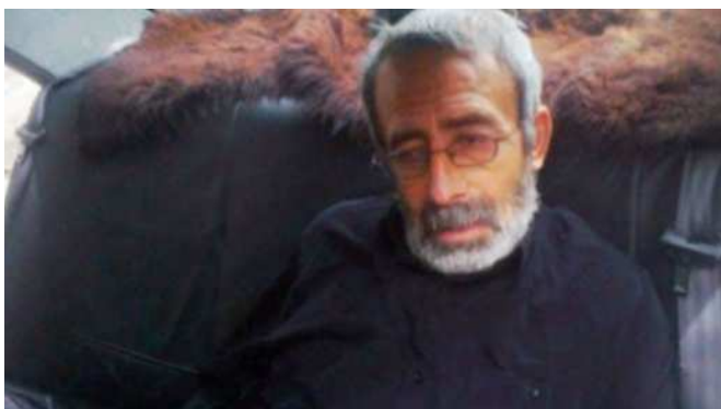
کانون مدافعان حقوق کارگر