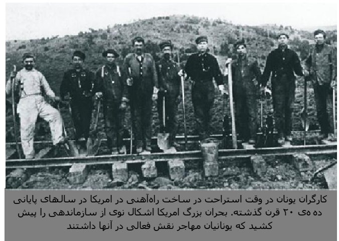
کارگران یونان در وقت استراحت در ساخت راه‌آهنی در آمریکا در سال‌های پایانی ده‌ی ۲۰ قرن گذشته. بحران بزرگ آمریکا اشکال نوی از سازماندهی را پیش کشید که یونانیان مهاجر نقش فعالی در آنها داشتند

قانون اساسی ۱۹۷۵ نخستین متن قانونی بود که در طی دوران طولانی از تاریخ قوانین اساسی یونان، به طور مشخص به کار و حقوق مربوط به آن پرداخته است. از جمله‌ی این اصول می‌توان از ماده‌ی ۲۲ پاراگراف ۱ در باره‌ی حق کار، ماده‌ی ۲ پاراگراف ۲ در باره‌ی مذاکره و تنظیم قرارداد جمعی کار، ماده‌ی ۲۳ پاراگراف ۱ در باره‌ی حق تشکل جمعی، و ماده‌ی ۲ پاراگراف ۲ در باره‌ی حق اعتصاب نام برد. تا قبل از آن تاریخ، تشکیل اتحادیه‌های صنفی بیشتر تابع قوانین مربوط به تشکیل مجامع عمومی بود، ولی امروزه این اتحادیه‌ها بر اساس قانون ویژه‌ی ۱۲۶۴،۱۹۸۲ در موضوع دموکراتیزه شدن جنبش اتحادیه‌های صنفی شکل می‌گیرند.