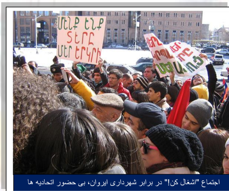
اجتماع "اشغال کن!" در برابر شهرداری ایروان، بی حضور اتحادیه ها

تیروهی آ نظارتیان ۱ ، تیلمان آلکساندر بوش ۲ دپارتمان اروپای مرکزی و شرقی - بنیاد فردریک ابرت - فوریه ۲۰۱۷