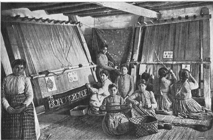
نختران قالیباف ارمنی در امپراتوری عثمانی، سال ۱۹۰۷، وان ترکیه

تیروهی آ نظارتیان ۱ ، تیلمان آلکساندر بوش ۲ دپارتمان اروپای مرکزی و شرقی - بنیاد فردریک ابرت - فوریه ۲۰۱۷ ترجمه: گودرز