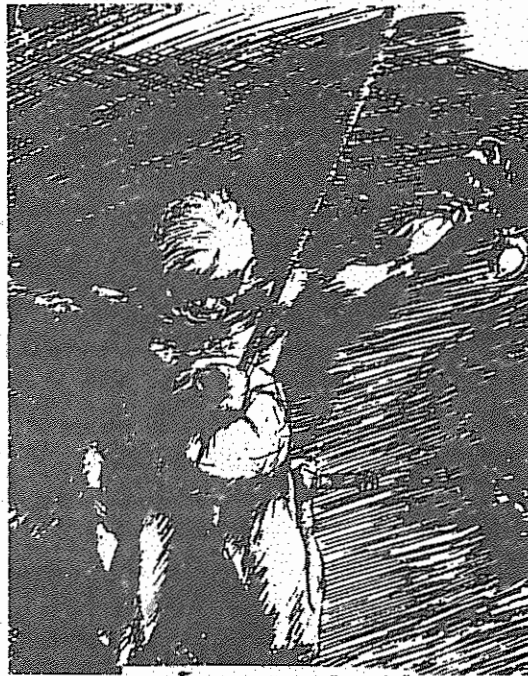
"شکنجه" طرح از سیابند آارات اسیر در زندان دیار بکر ترکیه

ژنرالها کلیه نشریات مترقی را تعطیل و نویسندگان و گردانندگان آنها را دستگیر کرده و اموال آنها را مصادره نمودند. کودتاچیسان قانونی را تصویب کردند که آزادی مطبوعات و آزادی بیان را از مردم سلب نمود. مطابق این قانون دادگاه های مخصوص مطبوعات منحل و دعاوی به دادگاههای اجرایی محول شد و دولت حق مصادره چاپخانه و اموال مخالفین را بدست آورد. روزنامه نگاران و نویسندگان