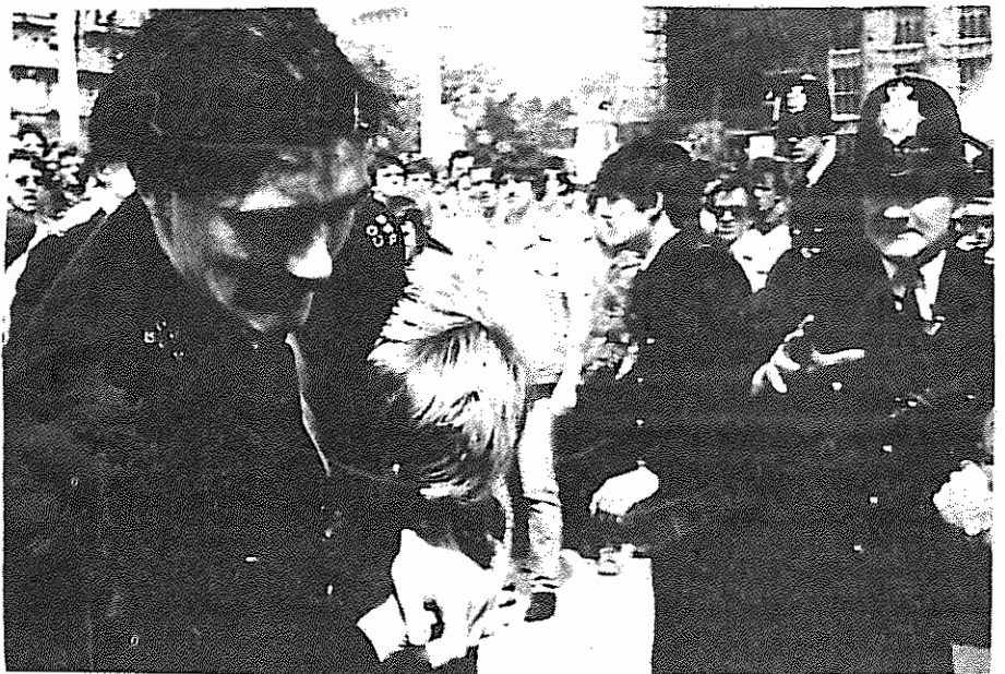
پلیس انگلستان در حال دستگیر کردن یکی از معدنچیان اعتصابی

پشتیبانی TUC از معدنچیان، پیروزی بزرگی برای کارگران اعتصابی و کل طبقه کارگر بریتانیا و ضربه مهمی به قوانین ضد کارگری و ضد اتحادیه‌ای دولت محافظه کار می باشد. حزب کمونیست بریتانیا به دنبال اعلام پشتیبانی TUC لزانین تصمیم استقبال نمود و خواستار آن شد که قطعنامه اتحادیه شوراهای کارگری بریتانیا در باره اعتصاب معدنچیان، با آکسیونهای مختلفی در سراسر کشور، به موقدا اجرا گذاشته شود. از نظر حزب کمونیست، "این قطعنامه بیش از پیش در توده‌های شدن اعتصاب معدنچیان، جسمی و کما مالی برای خانواده آنها و قطع رساندن زغال سنگ به مناطق صنعتی، موثر خواهد بود."