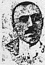
حیدر خان عمو و غلو ایران

تراکتی که بعد از شهادت حیدر خان عمو و غلو از طرف حزب کمونیست ایران منتشر شده است