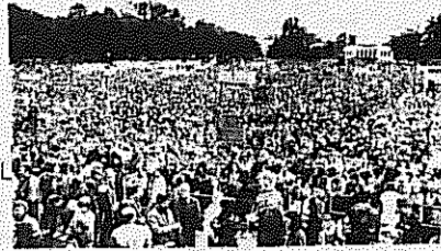
صاحبان ۵۰ هزار نفره در برلین

های آلمان، اختصاص ۵۰ میلیارد مارک بودجه به يك برنامه دولتی اشتغال زا، در کنار کاهش ساعات کار به ۳۵ ساعت در هفته، می تواند بطور اساسی ابعاد فاجعه بیکاری جمعی را کاهش دهد، دولت آلمان فدرال بخش بزرگی از بودجه خود را به برنامه های تسلیحاتی اختصاص می دهد و در عوض، بطور مستمر از ارقام مربوط به میمه های اجتماعی می کاهد.