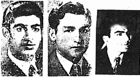
بزرگ نیا شریعت رضوی قندچی

قیام کننده برآمد قدرتمندی یافت. جنبش دانشجویی با شرکت فعال و همه جانبه در مبارزات ضد امپریالیستی، دموکراتیک مردم و در مبارزات قهرمانانه ای که به انقلاب شکوهمند بهمن و سرنگونی رژیم سلطنتی انجامید، عمق و اعتلا یافت و به سهم خود در تعمیق و اعتلای جنبش توده ای نقش موثری ایفا کرد.