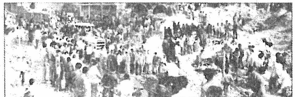
جنگ افروزان با میهن ما چه کرده‌اند!

اکنون در همه جا صحبت از جنگ و کشتار است و مردم به جای برگزاری مراسم نوروز، مجبور گشته‌اند به گورستان‌ها بروند تا قربانیان عفریت جنگ را به خاک سپارند. بگیر و ببند برای سر بازگیری شدت یافته و بسیاری از خانواده‌ها را در اضطراب فرو برده است. مردم به عینه حس می‌کنند در آغاز سال جدید باید یکبار دیگر آن هم به میزانی فاجعه بار، تاوان جنگ طلبی‌های رژیم را بپردازند. بهار امسال نیز با ویرانی و کشتار و عزاداری همراه شده است.