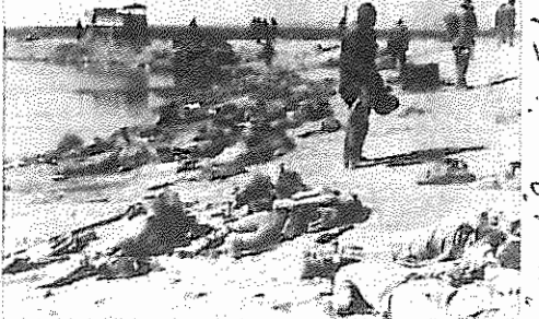
اجساد گروهی از نیروهای ایرانی در جریان عملیات بدر حمله به کشتی‌ها در خلیج فارس و به ویژه در اطراف جزیره نفتی خارک نیز در روزهای گذشته به شدت ادامه داشته است. در ۱۰ روز گذشته تقریباً هر روز عراق خبر از حمله به یک یا دو هدف دریایی داده است. در دو مورد نیز هواپیماهای عراقی به جزیره

سال جدید با حمله هوایی - عراق به تهران آغاز شد. تا هنگام تنظیم این گزارش حملات هوایی - به جز در روزهای شنبه سوم و یکشنبه چهارم فروردین بی‌وقفه ادامه داشته است. تهران، قزوین، اراک، تبریز، اهواز، گیلان، غرب، سندج، خرم‌آباد، ایلام، تویسرکان، زنجان، دزفول، همدان، بوشهر، بانه، مریوان، خمین، بیجار، کرمانشاه و صالح آباد از جمله شهرهایی هستند که در سال جدید هر یک عمدتاً بیش از دو بار مورد حمله هوایی قرار گرفته‌اند. تهران چند بار در طی این مدت شاهد حمله جنگنده‌های عراقی بود. نازی آباد، افسریه، و دولت آباد از جمله محلاتی از تهران بودند که در سال جدید، بر اثر بمباران بزرگ کشته شدند. در جبهه‌ها بعد از تکام ماندن عملیات بدر، حمله مهم جدیدی صورت نگرفته است. رفسنجانی در نماز جمعه هفته گذشته شکست در عملیات بدر را منکر شد و در ازای هزاران کشته، مدعی تصرف حورالعظیم گشت و آن را پیروزی بزرگی دانست. وی هم چنین اعلام کرد جمهوری اسلامی تدارک حمله جدیدی را می‌بیند. روز دوم فروردین اطلاعاتی در رادیوی جمهوری اسلامی خوانده شد مبنی بر این که نیروهای عراقی قصد حمله به پاسگاه ترابه را داشته‌اند، ولی جمهوری اسلامی تمرکز قوای آنها را از بین برده است. در روز ۴ فروردین سرفرماندهی ارتش عراق ادعا کرد که در جبهه شمالی حمله‌ای را صورت داده و دو ارتفاع مهم را به تصرف درآورده است. در اطلاعاتی مربوطه موقعیت جغرافیایی این دو ارتفاع مشخص نشده بود. جمهوری اسلامی به جز در روزهای سوم و چهارم فروردین بصره را مدام زیر آتش داشت. علاوه بر بصره توپخانه ایران خانقین، زبایتیه، سید صادق و مندلی را نیز زیر آتش گرفته است. در روز یکشنبه ۱۱ فروردین هشتمین موشک زمین به زمین به بغداد شلیک شد.