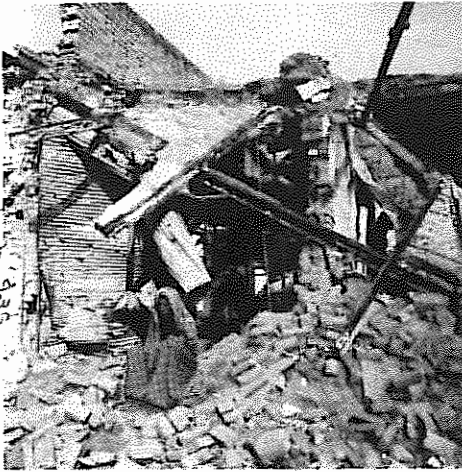
ارمغان ارتجاع برای مردم، مرگ و ویرانی

خارک حمله برده و بخشی از تاسیسات نفتی آن را با