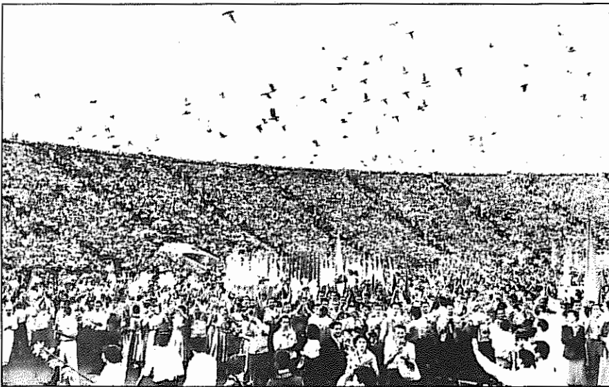
جشنواره جهانی جوانان و دانشجویان، وروش-۱۹۵۵

ریوموند دین مدتی پیش از برگزاری جشنواره برلین روی ریل قطار حامل تجهیزات نظامی ارتش فرانسه برای جنگ در هندو چین دراز کشیده و با این عمل متهورانه از ارسال محمولات جنگی جلوگیری کرده بود. وی بزودی به یک شخصیت معروف، به یک اسطوره در جنبش بین المللی صلح تبدیل گشت. برتولت برشت نویسنده، شاعر و کارگردان به نام