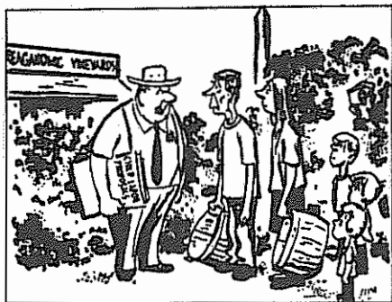
صاحب مزرعه آمریکایی: - طبق برنامه دولت برای کمک به کودکان، بچه‌ها پتان را استخدام می‌کنم، اما خودتان اخراجید.

این همه تصادفی نیست. جامعه‌ای که در آن درآمد ملی به حد غیرقابل تحمیل ناعادلانه تقسیم می‌شود، جامعه‌ای که میلیاردها دلار صرف تدارک جنگ می‌کند، به مسابقه تسلیحاتی دامن می‌زند و زندگی و آینده بشریت را به بازی می‌گیرد، کودکان خود را خوشبخت نمی‌کند.