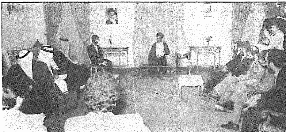
حجت الاسلام رئیس جمهورخامنه ای در حضور شاهزاده سعود الفیصل وزیر خارجه عربستان

لازم به ذکر است که در چند هفته اخیر اختلاف بین گروه های ضدانقلابی افغانی بر سر سهمشان از بودجه هفتگی که آمریکا برای ضربه زدن به جمهوری دموکراتیک خلق افغانستان اختصاص داده است، به اوج رسیده و به درگیری های خونینی منجر شده است. بقیه در صفحه ۱