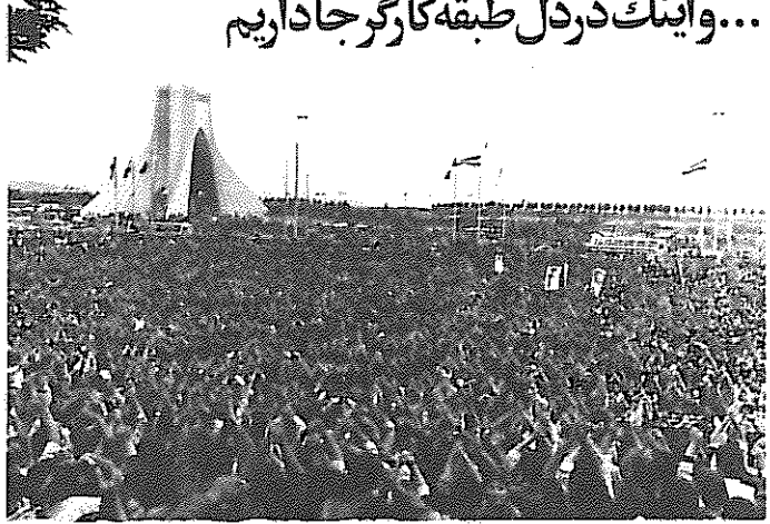
میتینگ فدائیان خلق در میدان آزادی - اول ماه مه سال ۱۳۶۰

ایفا نقش اصلی در سازماندهی تظاهرات اول ماه مه سال ۱۳۵۸، یکی از فرازهای مهم حیات سازمان ما به شمار می‌رود. این تظاهرات نمود پیوند فدائیان با طبقه کارگر بود. این تظاهرات، هم جشن روز کارگر بود و هم جشن این یگانگی. بعد از آن تجربه از پی تجربه آمد. هر اعتصاب، هر حرکت، بیان هر خواست، مدرسه‌ای بود که هم به طبقه کارگر می‌آموخت و هم به پیشاهنگ راستینش. مادری آموختن‌های زنده بقیه در صفحه ۱۲