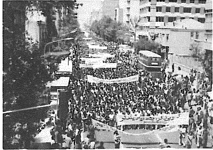
تظاهرات پرشکوه کارگران در اول ماه مه سال ۱۳۵۸