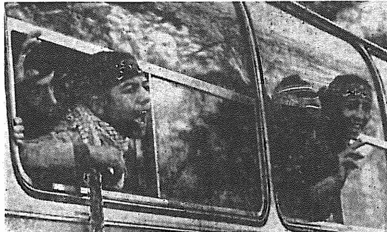
سفری بازگشت... نوجوانی ۱۴-۱۵ ساله است. شاید مادرش را صدا می‌زند این آخرین دیدار است. خمینی همچنان تشنه ریختن خون هزاران چون اوست

در ملاقات سفیر جدید آلمان فدرال با ولایتی وزیر امور خارجه جمهوری اسلامی، بار دیگر بر لزوم گسترش مناسبات دودولت تاکید شد. طرفین اظهار امیدواری کردند که در آینده نزدیک مناسبات طرفین گسترش قابل ملاحظه‌ای یابد. لازم به تذکر است که آلمان فدرال یکی از مهمترین طرف‌های بازرگانی جمهوری اسلامی محسوب می‌شود.