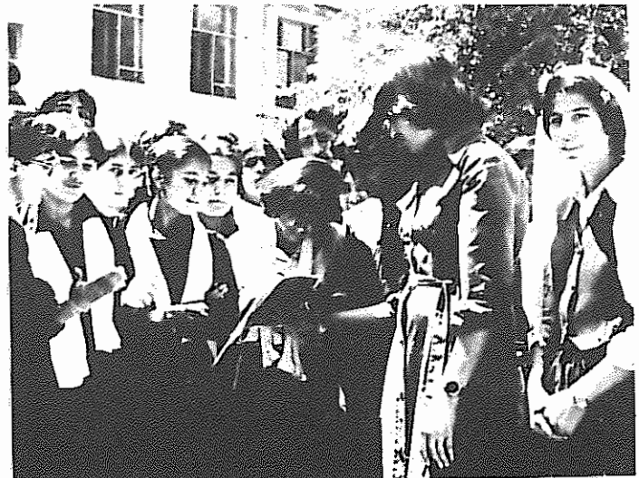
زنان دریند دیروز افغانستان، امروز در بازسازی جامعه فعالیت مشارکت دارند.

س: انقلاب ثور برای زنان چه دستاوردهایی داشته است؟ ج: زنان، نیمی از جمعیت کشور ما را تشکیل می دهند. شمار زنان در افغانستان نزدیک به ۷/۵ میلیون نفر است. بر اساس سیاست حزب ما، زنان در روند تحولات انقلابی در کشور سهم ارزنده ای ایفا می کنند. آنها در فعالیت های سیاسی، اجتماعی، اقتصادی و فرهنگی شرکت دارند. قبل از پیروزی انقلاب در افغانستان، سهم زنان در فعالیت های اجتماعی - اقتصادی ناچیز بود. با پیروزی انقلاب، برای نخستین بار در کشور ما برابری حقوقی مرد و زن در فواین کشور به تثبیت رسید. شمار زنانی که در کارخانجات کار می کنند افزایش یافت. تعداد بیشتری از زنان، در