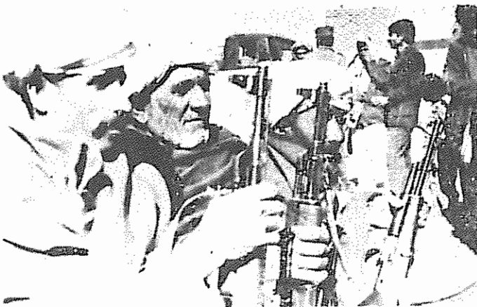
زحمتکشان افغانستان، مصمم به دفاع مسلحانه از انقلاب

— آمادگی برای همکاری وسیع سراسری ملی بر پایه منافع همه خلق و مصالح ملی. بقیه در صفحه ۱۴