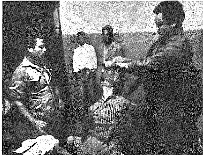
بازجویی از یک رزمنده فلسطینی در اردوگاه انصار

زندانیان از دیگران از طریق دادن امتیازات به آن‌ها، با شکست روبرو گردید.