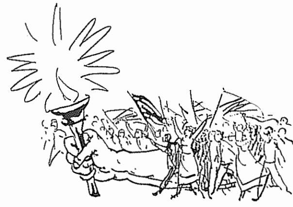
از سوی گروهی از فدائیان خلق در تهران کارت زیر بمناسبت سال نو منتشر و توزیع گشت.

* یک واحد در گزارش خود در مورد تبلیغات مربوط به ۱۹ بهمن سالروز بنیانگذاری سازمان از جمله نوشته است: "مجموع اوراق پخش شده ۲۰۰۰ برگ بود که از این تعداد ۴۰۰ برگ