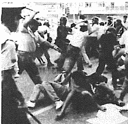
پلیس آفریقای جنوبی با شلاق به جان دانشجویان دانشگاه ژوهانسبورگ افتاده است.

اتحادیه سندیکایی آفریقای جنوبی (کوسا تو)، ائتلاف ضد آپارتاید موسوم به "جهبه متحد دمکراتیک" و سازمان دانش آموزی سراسری این کشور به نام "کمیته ملی بحران آموزشی" طی فراخوان مشترکی همه مردم آفریقای جنوبی را برای روز شانزدهم ژوئن که دهمین سالگرد سرکوب خونین قبان جوانان "سوتو" است، دعوت به اعتصاب عمومی کردند. قرار است در این روز کار در سراسر کشور متوقف گردیده و گردهمایی‌های اعتراضی علیه رژیم آپارتاید برگزار شود. اسقف "توتو" رهبر کلیسای پروتستان آفریقای جنوبی نیز از این فراخوان حمایت به عمل آورده است.