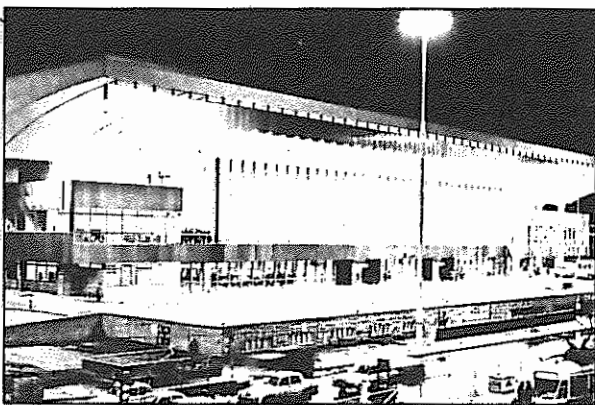
ایستگاه راه آهن مرکزی ورشو

رژیم ولایت فقیه را افکار عمومی جهان در حکم دمل عفونت باری بر بیکر بشریت می‌شناسند. در رسوا ساختن این رژیم ننگین، افشاکری گسترده نیروهای مترقی ایرانی و احزاب و سازمانهای پیشرو جهان نقش بی بدیلی ایفا کرده است. اما گذشته از این نمایندگان و وابستگان این رژیم در خارج از کشور نیز خود با رفتار و کردار نفرت انگیزشان نتوانسته‌اند، گوشه‌هایی از کراهت ذاتی این رژیم سیاه را به جهانیان شناسانند. این موجودات علاوه بر فساد متعارف هر وابسته یک رژیم پاسدار ناپرابری طبقاتی، از قبیل دزدی، آژمندی، جاه طلبی، زدو بند و... فساد خود ویژه‌ای در چاشنان