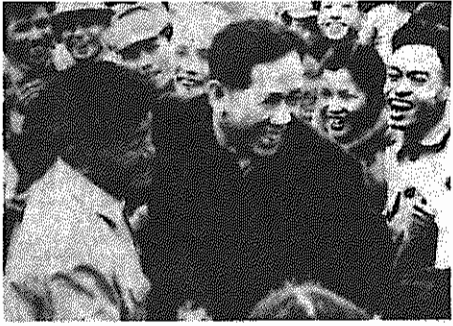
شواهر ۱۹۷۰، له دوان در میان مردم روستایی

له دوان از رهبران برجسته جنبش جهانی کارگری و کمونیستی و دبیرکل کمیته مرکزی حزب کمونیست ویتنام، بدنبال یک بیماری سخت و طولانی، پنج شنبه گذشته در سن ۷۹ سالگی درگذشت. در ویتنام، به مناسبت این فقدان بزرگ، پنج روز عزای عمومی اعلام شد. له دوان در تاریخ ۷ آوریل ۱۹۰۷ متولد شد.