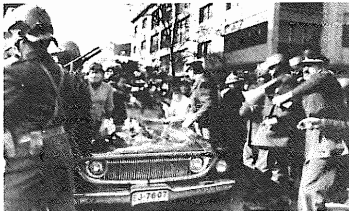
در تشییع جنازه دانشجوی ۲۲ ساله‌ای که طی اعتصاب عمومی بدست ارتش پلیس به قتل رسید، نیروهای سرکوبگر پینوشه بار دیگر به خشونت متوسل شدند.

که حتی اعضای واحدهای ویژه پلیس در هنگام اعتصاب عمومی از اپوزیسیون حمایت کردند. در کنفرانس مطبوعاتی سانتیاگو اعلام شد حزب کمونیست شیلی روی کار آمدن یک دولت نظامی بدون پینوشه را ممکن می‌داند و معتقد است این امر می‌تواند راهی در جهت بازگشت به دموکراسی باشد.