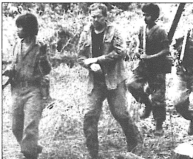
۱۹۸۶: یوجین هازنفوس، مستشار نظامی آمریکایی در ماموریت کمک رسانی به ضد انقلابیون و با سرنگونی هواپیمایش، به اسارت انقلابیون در آمده است. متجاوز را عاقبتی جز این نیست.