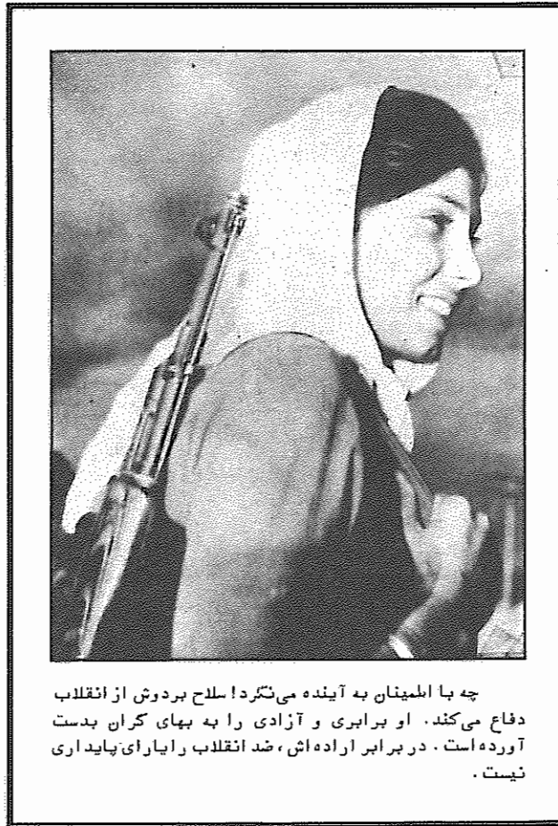
چه باطمینان به آینده می‌نگرد! سلاح بردوش از انقلاب دفاع می‌کند. او برابری و آزادی را به بهای گران بدست آورده است. در برابر اراده اش، ضد انقلاب را یارای پایداری نیست.

رهبران مختلف، که هر چه بیشتر در پایتخت‌های غربی به سر می‌برند تا حمایت جلب کنند، هر سه ماه یک بار به نوبت مقام سخنگوی این سازمان را عهده دار می‌شوند. اما طرحی برای متحد کردن مخالفان تحت رهبری ظاهر شاه پادشاه پیشین که اینک در رم به سر می‌برد، بر اثر رقابتهای گروهی