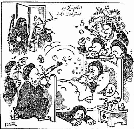
تاریکاتوری از لوموند تاریخ ۲۵ اکتبر

رسانه‌های خارجی: "خمینی سخته کرده است و به توصیه بزنتگان احتیاج به استراحت دارد".