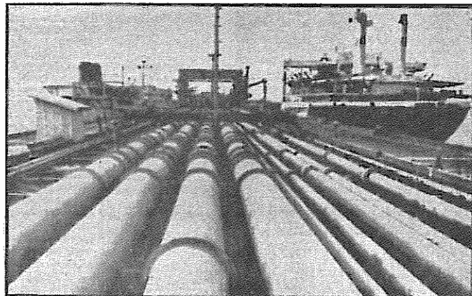
در سال ۶۵ صدور انبوه نفت ارزان برای رژیم مقدور نشد. خطوط انتقال نفت از کار بازمانده اند. اقتصاد نفتی فلج شده است.

ویژگی بحرانهای اقتصادی بدین گونه است که همواره تأثیری دوگانه بر فعل و انفعالات اقتصادی می‌گذارند. تأثیرات جاری و تأثیرات آتی. رابطه این دو گونه تأثیر، رابطه‌ای کسب‌کننده نیست. نتایج بحران حتی پیش از پدیدار شدن بر بحران جاری می‌افزایند و تأثیرات آتی بحران در فزاینده زمانی