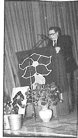
رفیق کارل هاینس شرودر، عضو هیات سیاسی کمیته مرکزی حزب کمونیست آلمان به هنگام قرائت پیام

دیتلر شیتسل عضو پارلمان اروپا از طرف حزب سوسیال دمکرات آلمان - آخن