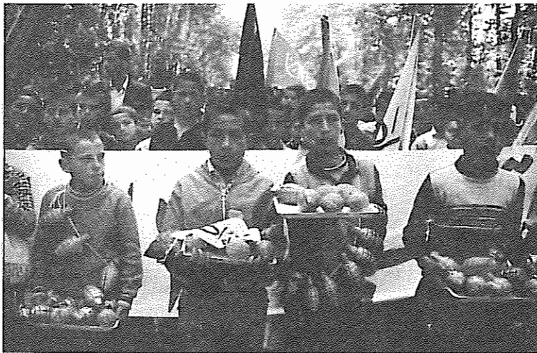
سال ۶۶ بجای "قلک" و "نانچک" از "تانک" ابرای جمع آوری کمک مالی به جیبه استفاده خواهد شد

مسئول ستاد درسخان خود تاکید کرد که ۶۰ درصد نیروهای "سپاهیان صدهزار نفری محمد" و "مهدی" که در عملیات کربلای ۴ و ۵ و ۶ شرکت داشتند را دانش آموزان تشکیل داده اند. وی افزود: "ستاد" توانسته برنامه های نظامی خود را در استانهای یزد، اصفهان، زنجان و اراک درمقاطع مختلف تحصیلی به اجرا بگذارد. مسئول ستاد