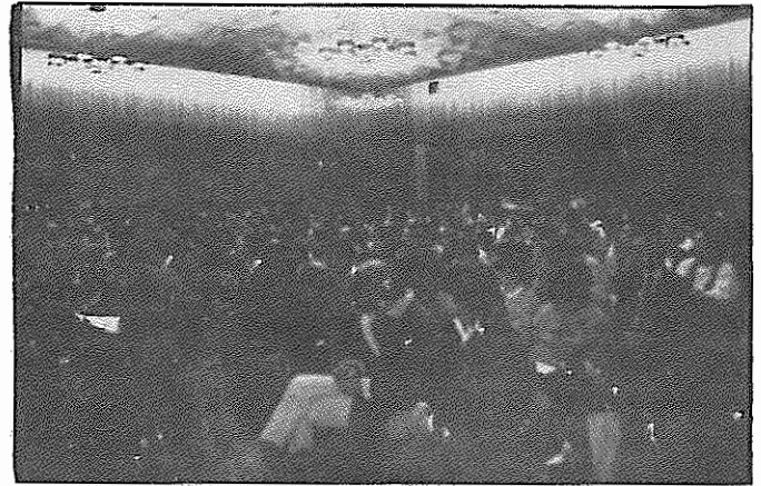
"اشقات هاله" شهر کلن مملو از جمعیتی است که از گوشه و کنار آلمان فدرال برای بزرگداشت سالروز ۱۹ بهمن گرد آمده اند