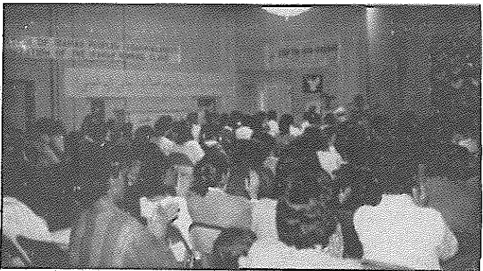
صحنه ای از مراسم بزرگداشت ۱۹ بهمن در دالاس

ایرانیان مرفقی و دوستداران و یاران خارجی سازمان فداییان خلق ایران (اکثریت) در شهرهای دالاس، برکلی، پرتلند، مهلوآکی و نیویورک برگزار کردند.