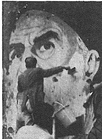
بدنبال ورود نیروهای سوری به غرب بیروت، روی عکسهای خمینی را رنگ می زنند.

معمّر قذافی رهبر لیبی در مصاحبه با روزنامه نگاران عرب در طرابلس گفت نقشه حزب الله لبنان برای ایجاد یک جمهوری اسلامی به سبک ایران در این کشور، به ناپودی نیمی از لبنان خواهد انجامید. قذافی افزود "جهاد مقدس" مورد نظر حزب الله در لبنان، به معنای تروریسم و چگونگی است.