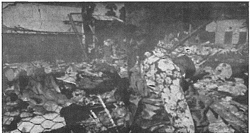
مزدوران رژیم آپارتاید خانه این زن اهل زامبیا را ویران کرده‌اند

کنگره، طی یک قطعنامه خواهان وحدت همه کمونیستهای اسپانیا در یک حزب واحد و بزرگ گردید که مهمترین ویژگیهای آن عبارتند از: حزبی براساس ملی و طبقاتی، حزبی پیشاهنگ، حزبی توده‌ای، حزبی مستقل و انترناسیونالیست، حزبی همبسته با جنبش جهانی کمونیستی، حزبی که ایدئولوژی و سیاست آن بر اصول مارکسیسم - لنینیسم استوار باشد، یک حزب لنینی که وارث بهترین سن کمونیستهای اسپانیا گردد. حزب کمونیست خلقهای اسپانیا برای تدوین برنامه این حزب و انجام بحث‌ها، پیشنهاد تشکیل یک کمیسیون ملی وحدت را می‌دهد.