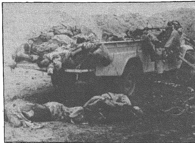
چگونگون جنگ طلبی تاکی قربانی خواهد گرفت ؟

اسرائیل را تحت الشعاع قرار دهند . همان گونه که در شماره های پیشین اکثریت خاطر نشان کردیم ، جنگ ایران و عراق مهم ترین حربه ای است که در خدمت مراداران " اردوی کتب دیوید " در میان دولت های عربی قرار گرفته است و از آن جایی که مصر رسماً از اتحادیه عرب اخراج شده ، در کنفرانس اخیر سران عرب ، ملک حسین پادشاه اردن عهده دار بکارگیری این سلاح بوده است . هر چند کنفرانس در اثر مخالفت های دول متری عرب ، طرح پذیرش مصر به خانواده