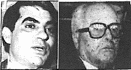
حبیب بورقیبه زین العابدین علی

حبیب بورقیبه رئیس جمهور ۸۴ ساله تونس که از سال ۱۹۵۷ این مقام را عهده دار بود توسط زین العابدین علی نخست وزیر کشور برکنار شد. پس از برکناری حبیب بورقیبه، بن علی چانشین او اعلام داشت که تغییراتی در قانون اساسی، قانون مربوط به فعالیت احزاب سیاسی و قانون مطبوعات داده خواهد شد. مقامات جدید اعلام کردند که حبیب بورقیبه هم اکنون در کاخ کارتاژ اقامت دارد.