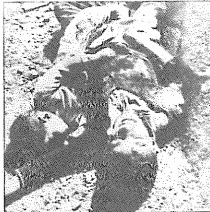
دو کودک در کنار هم جان سپرده‌اند صفحه فحشیمی از قتل عام حلبچه

دورژیم در تدارک قتل عام شیمیایی هستند. گسترش کاربرد سلاح‌های شیمیایی در جنگ دورژیم چنانیکار به یک خطر واقعی تبدیل شده است. رژیم خمینی تهدید عراق به استفاده از سلاح‌های شیمیایی در حمله به شهرهای بزرگ ایران را