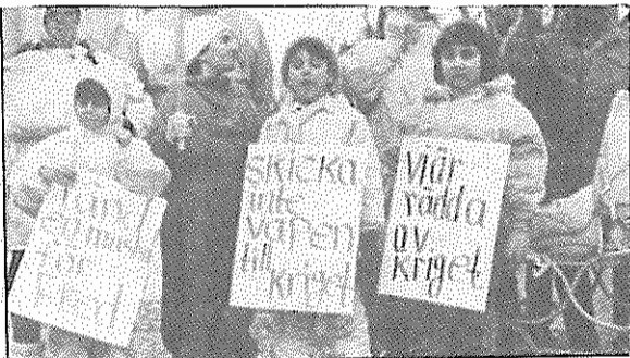
سوئد: کودکان ایرانی در صف تظاهرات علیه جنگ

* روز جمعه ۲۰ اسفند (۱۱ مارس) تعدادی از خیابانهای مرکزی شهر لولوشا در امییبایی اعتراضی جمعی از ایرانیان مقیم این شهر بود. راهپیمایان با دست داشتن باندرول‌ها و پلاکاردهایی که شعارهایی چون "جنگ ایران - عراق را فطرح کنید، ما صلح می‌خواهیم" بر آنها نقش