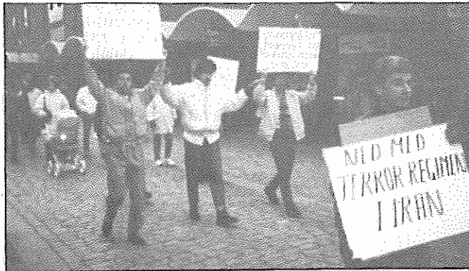
صحنه‌ای از تظاهرات ضدجنگ در شهر فالکن بری - سوئد

در محل تظاهرات پلاکاردهایی حاوی شعارهایی با خواست قطع فوری جنگ شهرها و اجرای قطعنامه ۵۹۸ شورای امنیت و قطع ارسال سلاح به ایران و عراق دیده می‌شد.