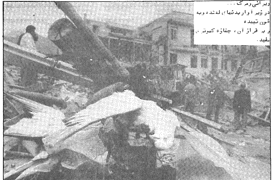
ویرانی و مرگ... در زیر آوار بدشتیا، لنده و به خون تبدیله و به فراز آن، جنازه کموتی سفید.

اطلاعه نمایندگی کمیته مرکزی سازمان فدائیان خلق ایران (اکثریت) در اروپا جنگ شهرها با شدت ادامه دارد، اعتراض خود را نیرومندتر کنیم! در صفحه ۲