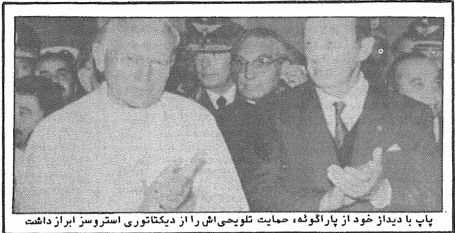
پاپ با دیداز خود از پاراگوئه، حمایت تلویحی اش را از دیکتاتوری استروسز ابراز داشت

در فراخوان کنگره ملی آفریقا آمده است تنها با اقدامات متحد، مردم آفریقای جنوبی قادر