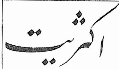
نثر به سازمان فدائیان خلق ایران (اکتبر) در خارج از کشور

در دو هفته اخیر جنگ نفتکشها تشدید شده است. در روز شنبه ۲۴ اردیبهشت هواپیماهای جنگنده عراقی به ۴ نفتکش در جوار جزیره لارک حمله بردند. بر اثر این حمله، که برای جمهوری اسلامی غیر منتظره بود، دو نفتکش قول پیکر در اجاره جمهوری اسلامی که بزرگترین نفتکشهای جهان محسوب می‌شوند، منعدم گردیدند. در ابتدا اعلام شد که از ۴۰ ملوان شافل در این کشتی‌ها اثری در دست نیست.