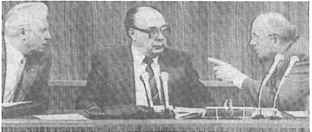
از چپ بر راست: یگور لینگاچف، الکساندر یاکولف، میخائیل گارباچف

انگیزه در گرفتن این بحث، از جمله مقاله‌ای در نشریه فکاهی "اوتونیوک" بود که بدون ذکر نام، برخی از نمایندگان کنفرانس را "فاسد" لقب داده بود. در کنفرانس اینگونه اتهام‌زنی با مخالفت شدیدی روبرو شد. الکساندر یاکولف، دبیر کمیته مرکزی حزب، با اشاره کنفرانس در یک مصاحبه مطبوعاتی در پاسخ به سؤالی در مورد تنوع نظرات نمایندگان اظهار داشت: "گمان نمی‌کنم افرادی وجود