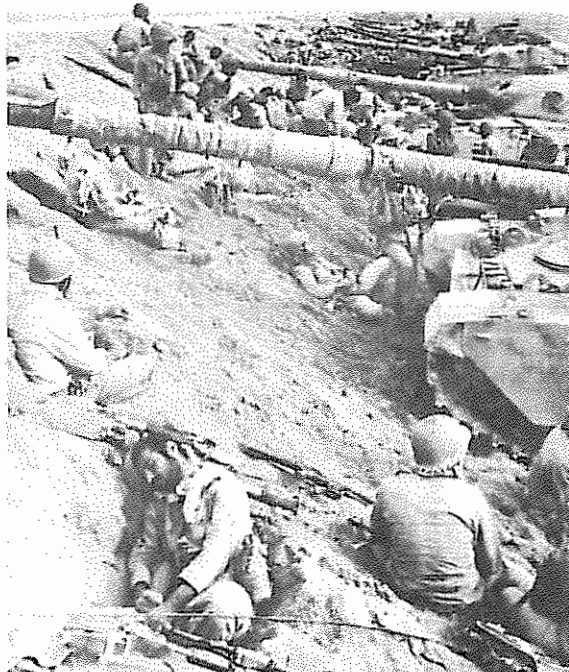
زرادخانه را شاید بتوان انباشته نگه‌داشت اما با سر بازان خسته چه می‌توان کرد.

که به عقب نشینی نیروهای اسلام از مواضع قبلی انجامید، محصول تلاشهای دوسه ساله نیروهای استکباری است. در این بیانیته از شکستهای نظامی رژیم به عنوان "یک اتفاق هادی" نام برده شده و در همین حال مرحله فعلی جنگ به