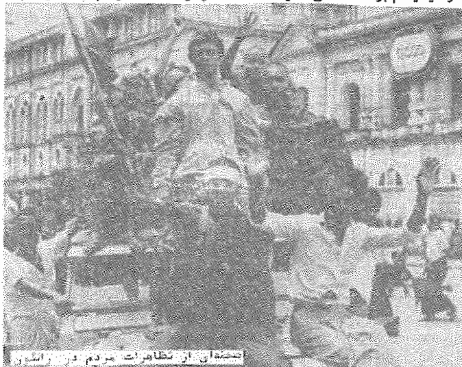
مجموعه‌ای از تظاهرات مردم در برمه

در برمه، مخارج کمرشکن بوروکراسی و ارتش، مدام سفره تمی زحمتکشان را تهمی‌تر کرده است. در سپتامبر سال گذشته رژیم نه‌وین، چندنوع اسکناس را بدون حق تعویض از اعتبار انداخت و تمهیدات دیگری ظاهرا برای مبارزه با بازار سیاه برنج، به مرحله اجرا گذاشت که دیگر طاقت مردم را طاق کرد.