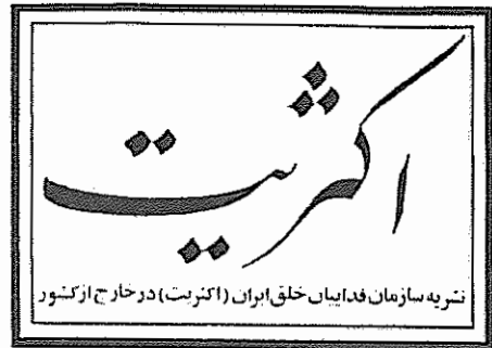
نشریه سازمان فدائیان خلق ایران (اکتبر) در خارج از کشور

چهاردهمین نمایشگاه بین‌المللی بازرگانی تهران در شرایط فعلی کشور و در دوران موسوم به "بازسازی اقتصادی" از اهمیتی ویژه برخوردار است. این نمایشگاه بنا به همین شرایط ویژه، ادامه نمایشگاه سال قبل نبوده، بلکه کیفیت دیگری را نمایندگی می‌کند. آنگاه که فروب نمایشگاه چهره "گردشگاهی" خود را از دست می‌دهد و فوج، فوج انسانهایی که برای لحظه‌ای تفریح و یا خرید یک یا چند کالای نایاب به محوطه هجوم آورده‌اند، محوطه نمایشگاه را ترک می‌کنند، وظیفه اصلی نمایشگاه آغاز می‌شود. دیدار هیاتهای اقتصادی و فنی، البته همه روزه در خارج از محیط نمایشگاه ادامه دارد. قراردادهای پی ریخته می‌شوند و در کورس طلائی "مشارکت مقدس" در امر بازسازی اقتصادی "کشور دوست ایران"