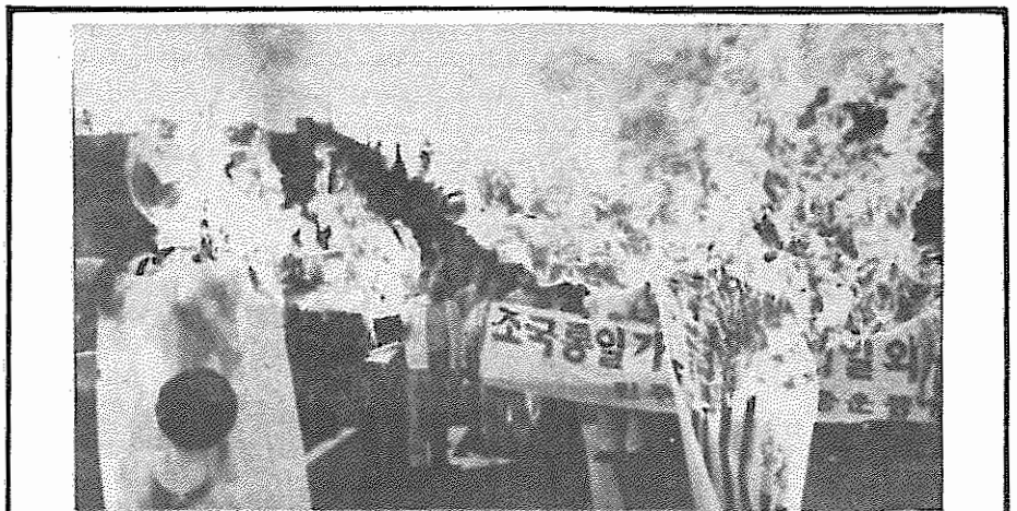
آنطرف دهکده المپیک در سئول: هر روز دانشجویان کره‌ای دست به تظاهرات می‌زنند و واقعات کره جنوبی را که رژیم حاکم می‌کوشد آن را در پشت زرق و برق‌های المپیک، پنهان کند، انفا می‌سازند. عکس‌بالا دانشجویان کره‌ای را در تظاهراتی که هفته گذشته بر پا کردند، نشان می‌دهد. آنها پرچم‌های ژاپن و آمریکا را به آتش کشیده‌اند.

● در هفته گذشته اسرائیل برای نخستین بار راسا یک ماهواره اکتشافی به فضا پرتاب کرد. متخصصین اسرائیلی برای ساختن این ماهواره، از کمک فنی آمریکا برخوردار بوده‌اند. ماهواره اسرائیلی نقل و انتقال‌های نظامی در منطقه را کنترل خواهد کرد.