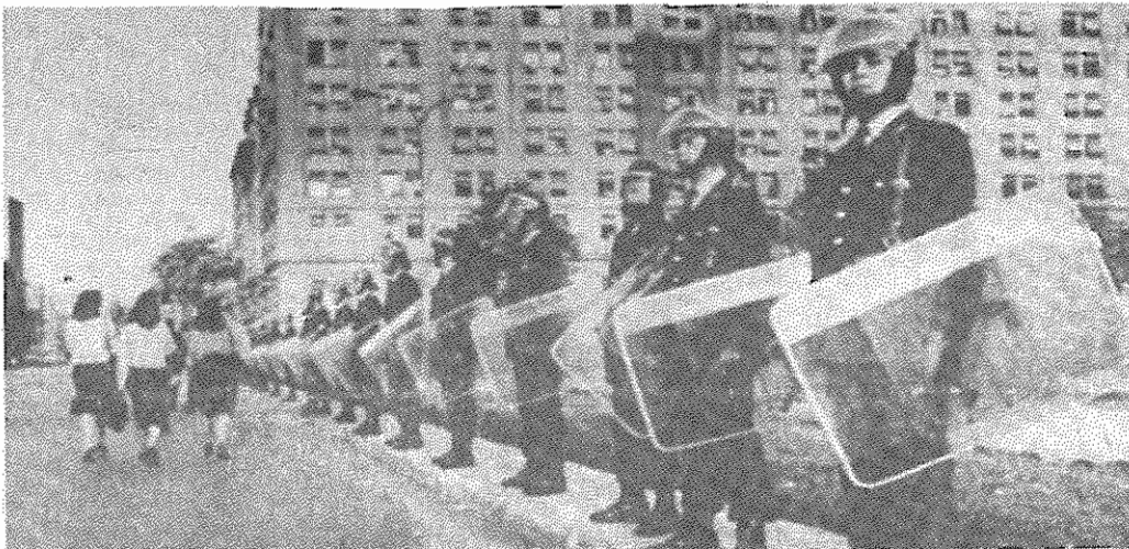
پلیس در سانتیاگو - پیرویه سرکوبگر، هنوز قدرت را در دست دارد.