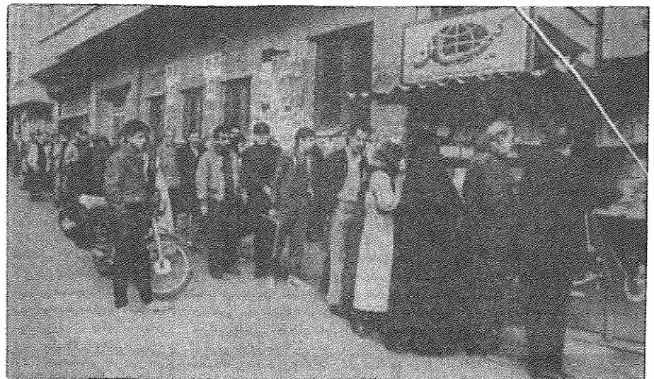
برای دریافت هر چیز باید ساعت‌ها در صف بود و این، صف خرید روزنامه است. به هلت کمبود کافذ دوباره نشریات در خطر تعطیلی قرار گرفته‌اند. تیراژ برخی روزنامه‌ها بخاطر فروش دوباره کافذ آن افزایش یافته است.

روزنامه "القیس" چاپ کویت اعلام کرد که حکومت اسلامی ایران قصد دارد از طریق ایجاد یک ائتلاف بین گروه‌های مسلح حزب الله، جنبش شیعیان اهل، دروزیان و گروه‌های مسلح مخالف یاسر عرفات، با جلب حمایت دولت سوریه یک