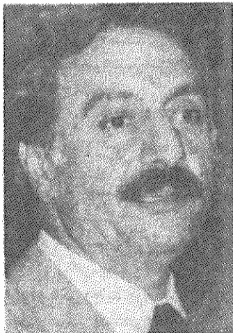
بیتمبر صفحه ۳

صبح روز جمعه ۳۰ تیرماه مراسم ادای احترام به دکتر عبدالرحمن قاسملو دبیرکل حزب دموکرات کردستان ایران و عبدالله قادری از رهبران این حزب در پاریس برگزار شد. تابوت حامل پیکرهای آنان از اتریش به فرانسه حمل شده و در مرکزی به نام انستیتو کرد قرار داده شده بود. از ساعت ۱۰ صبح مراسم ادای احترام آغاز شد. نمایندگان سازمان‌ها و