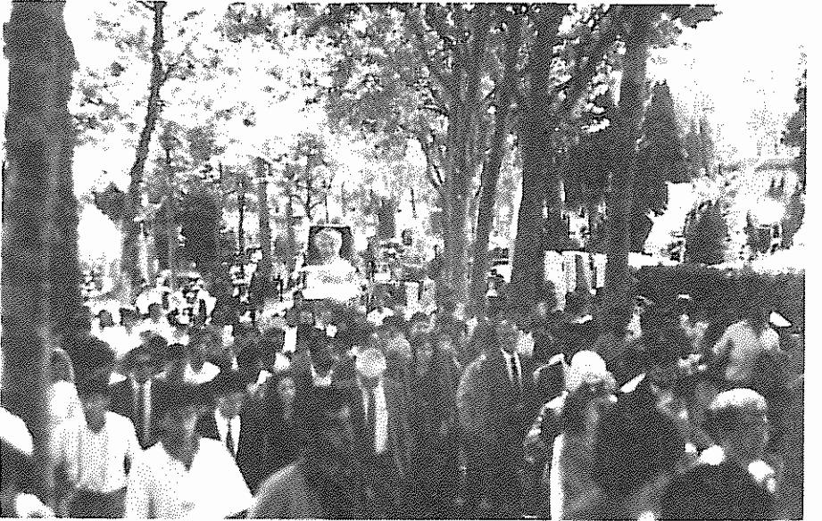
راهپیمایی بیش از سه هزار نفر از میدان ریپوبلیک پاریس به سمت گورستان پرلاشز برای تشییع رهبران شهید خلق کرد؛ گزارش مراسم آخرین وداع با دکتر قاسملو در شماره گذشته نشریه درج شد.