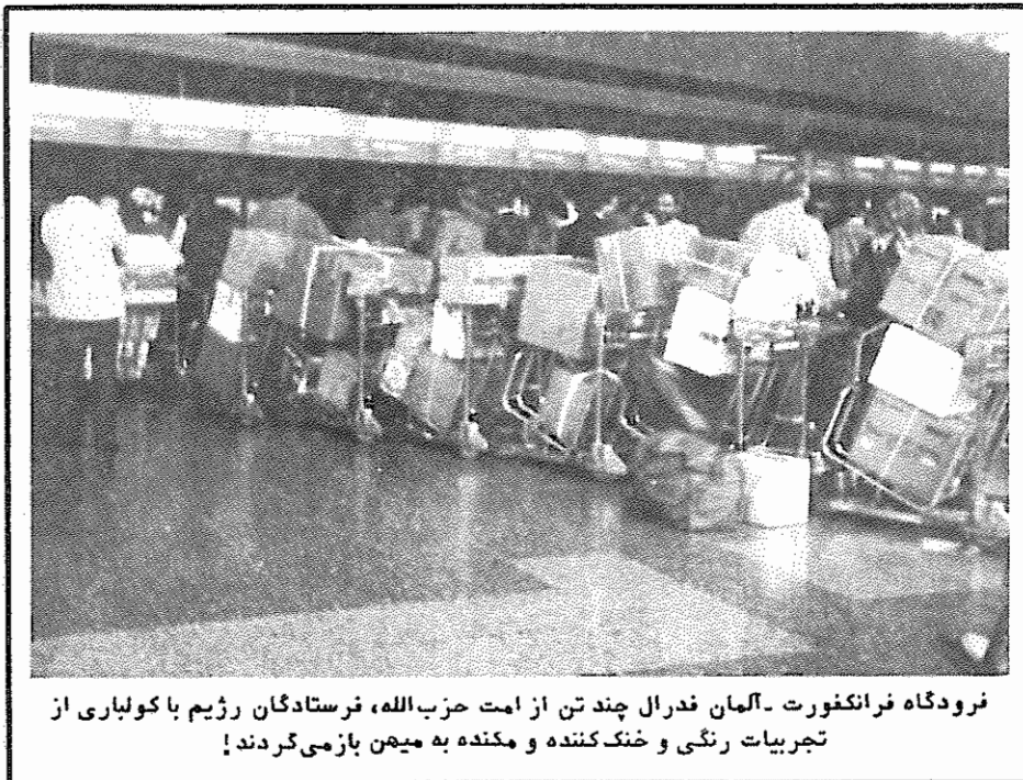
فرودگاه فرانکفورت - آلمان فدرال چند تن از امت حزب الله، فرستادگان رژیم با کولباری از تجربیات رنگی و خنک کننده و مکنده به میهن بازمی گردند!