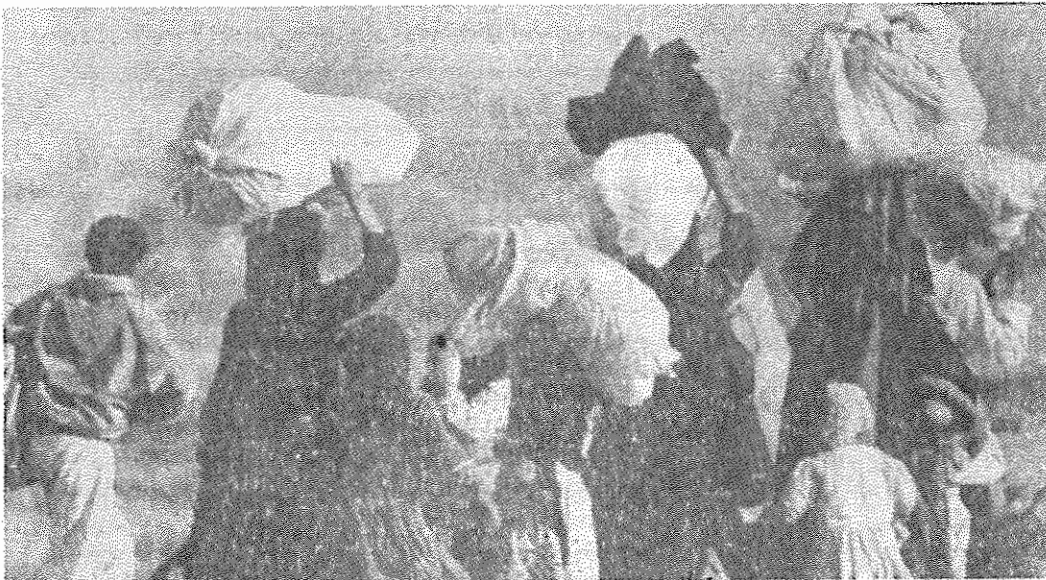
آواره، بی سر پناه به سوی سرنوشتی مبهم، بختک شوم جمهوری اسلامی میلیون‌ها ایرانی را خانه خراب و خانه بدوش کرده است.

شرح ماوقع از این قرار است که چندسالی است که این شرکت ضرر می‌دهد. روزی در اواسط خردادماه امسال هنگامی که رانندگان از سرویس بازمی‌گشتند رئیس شرکت به آنان اعلام کرد که به هلت ضرر دادن شرکت از این پس تریلرها فقط بصورت اجاره‌ای در اختیار رانندگان قرار خواهد گرفت. بنا بر تصمیم هیات مدیره شرکت و وزارت بازرگانی رانندگان باید بابت هر تریلر اسکانیا ۶۰۰۰۰۰۰ ریال و هر تریلر ماک ۴۵۰۰۰۰۰ ریال به عنوان اجاره ماهانه می‌پرداختند. رانندگان که