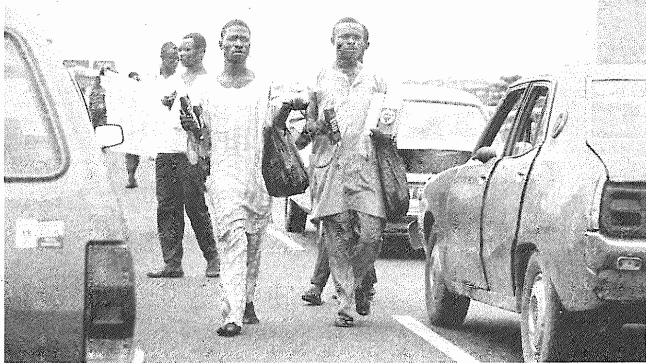
فرهنگیان دوره‌گر در لاکوس، پایتخت نیجریه، هر چیز را که قابل حمل باشد، می‌فرستند.

پس از چهل سال ممنوعیت، روز یکشنبه ۲۹ ژوئیه حزب کمونیست آفریقای جنوبی طی یک گردهمایی بزرگ در استادیوم فوتبال سوئو، از سرگیری فعالیت علنی خود را اعلام کرد. در حضور بیش از ۵۰ هزار تن از مواداران حزب، اسامی اعضای رهبری ۲۱ نفره حزب اعلام شد. جو سلوو، دبیر کل حزب، کریس هانی، فرمانده ارتش رهایی بخش مشترک کنگره ملی