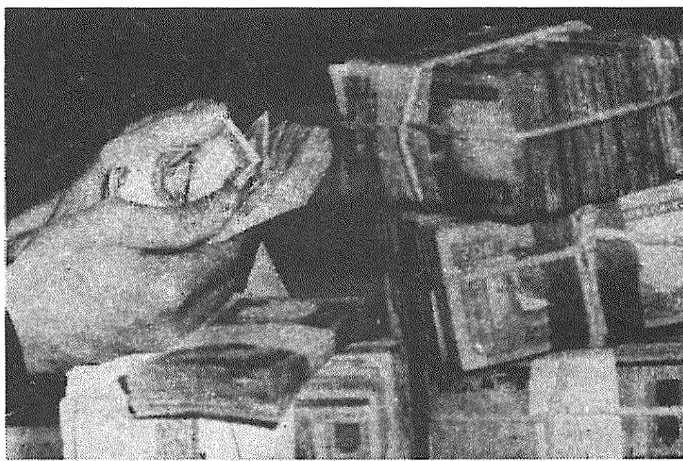
تنگنای ارزی و چاپ بی پشتوانه اسکناس، ریال ایران را آتندر بی ارزش کرده است که در خیلی از موارد روز مره باید بسته های اینچنین اسکناس دودل کرد.

صندوق بین المللی پول و بانک جهانی، موسساتی وابسته به سازمان ملل هستند. اما بر خلاف سایر سازمان های وابسته به سازمان ملل، در این موسسات اصل «هر کشور یک رای» حاکم نیست. دولت ها به تناسب سهمیه و حق عضویت خود در این موسسات اقتصادی بین المللی، در تعیین سیاست های آنها نقش دارند. از همین رو، طی دهه های گذشته، تعیین کننده ترین نیروی تصمصم گیری درباره اینکه به کدام کشورها از محل ذخایر و اعتبارات صندوق و بانک، وام و کمک داده شود، ثروتمندترین کشورهای سرمایه داری بوده اند. هر چند اخیرا نفوذ سایر کشورها در این موسسات افزایش یافته است، اما کماکان سیاست این ارگانها را بطور عمده بزرگترین کشورهای سرمایه داری تعیین می کنند. از این رو، اتحاد شوروی و