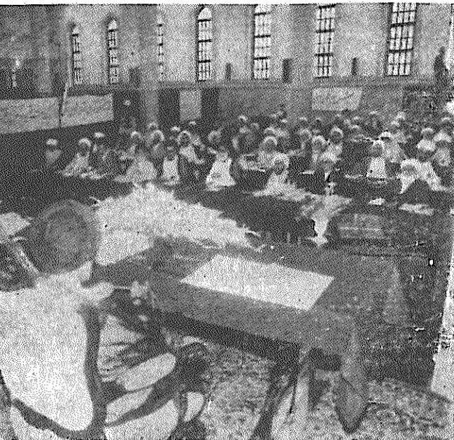
اجلاس هشتم مجلس خبرگان در روزهای پایانی تیرماه در تهران برگزار شد. مشکینی، رئیس، و رفسنجانی، عضو هیئت رئیسه این مجلس، در جلو نشسته‌اند.

نگرانی محتشمی بی‌موده نیست. اگر قرار باشد در آینده، صلاحیت نامزدهای نمایندگی مجلس خبرگان را فقهای شورای