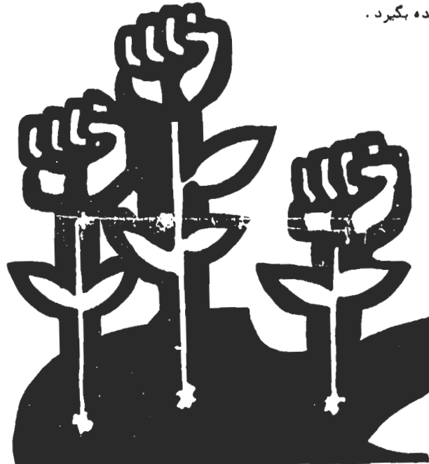
محدودیت کار سندیکا

وضعیت و مسائل طبقه کارگر و انتخاب صحیح‌ترین اشکال و شیوه‌های مبارزه در جهت خواست‌های کارگران است. البته همه این کارها باید در چهارچوب برنامه‌ای که در مجمع عمومی به تصویب رسیده عملی گردد. سندیکا تنها وقتی میتواند نقش موثری داشته باشد که دربرگیرنده اکثریت کارگران فعال و مبارز باشد در جهت خواست‌های واقعی کارگران حرکت کند. سندیکا باید پیوندش را با اعضا همواره مستحکم تر سازد و پاسخگوی نیازهای کارگران باشد. کارگران بایستی در انتخاب هیئت‌مدیره و اعضا مسئول سندیکا زیاد دقت کنند. این اشخاص باید از میان عناصر صادق و وفادار به طبقه و صنف خود باشند. در مبارزات کارگران صادقانه شرکت داشته و دارای تجربه مبارزاتی باشند.