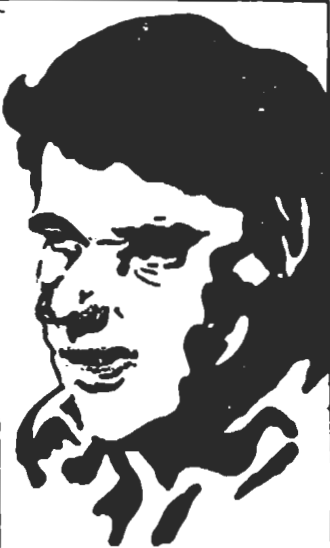
درد ما بر:

ما نامین آزادیهای دموکراتیک را برای تمام زنان و مردان ایرانی و برسمیت شناختن آزادیهای فرهنگی و قومی و حقوق ملی همه خلقهای ایران را خواستاریم.