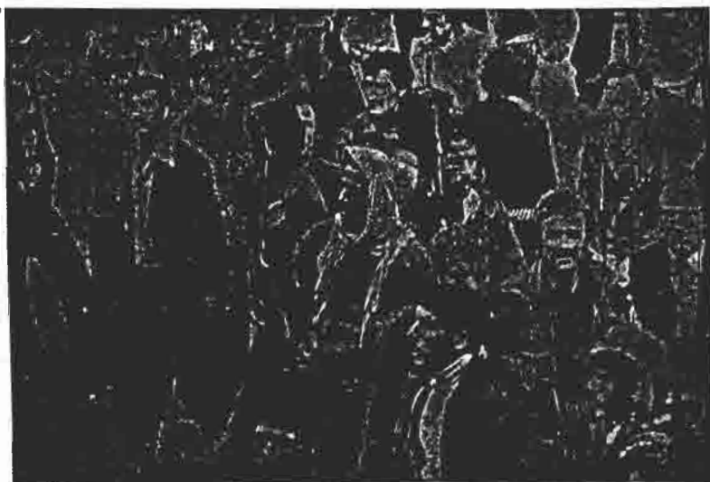
رزمندگان خلق کرد در سندج در مقابل توطئه خائنه عناصر ارتجاعی و ارتش جانانه نبرد کردند . آنها ثابت نمودند که برای احقاق حقوق ملی و دمکراتیک خلق کرد آماده هرگونه فداکاری و جانبازی میباشند .