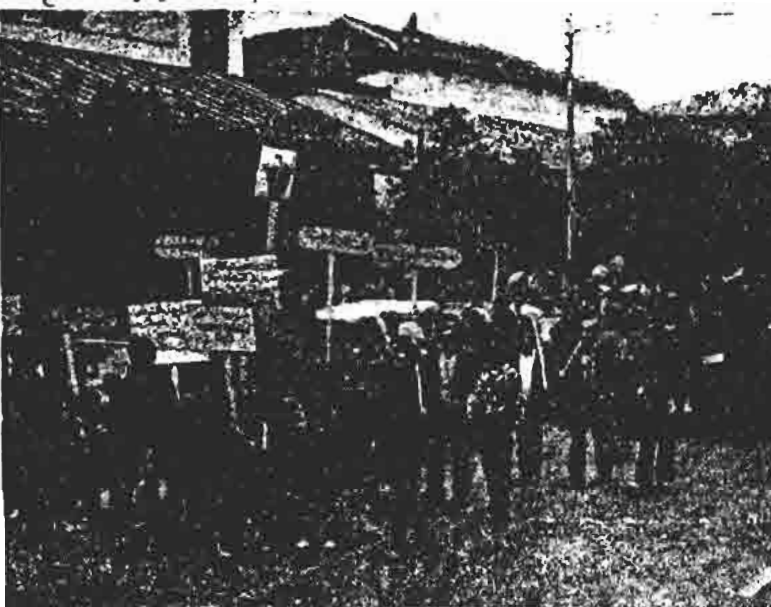
صحنه ای از تظاهرات و راهپیمایی روستائیان قیام آباد آمل

"ثابود باد توطنه مالکین و سرمایه داران ضد خلق." "قشرده تر باد صفوف آزادگان" "زمین مال کسی است که روی آن کار می کند." آنان پس از مذاکره با مسئولین امر در روز بعد اعلامیه ای بخش کردند. در قسمتی از اعلامیه آمده است: