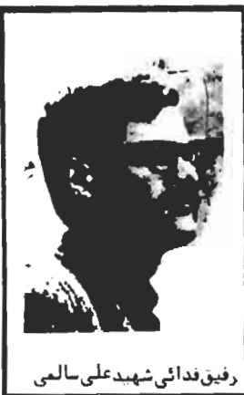
رفیق فدائی شهید علی سالمی

گرامی باد رفقای شهید... چنگیز قبادی - مهربان ابراهیمی - محمد علی سالمی - منوچهر بهائی - علی پروین فاطمی - هما یون کتیرائی - بهرام طاهرزاده - ناصر کریمی - هوشنگ تره گل - رفقای شهیدی که ما را با همی کنیم ، عمدتاً در مهرماه سال ۵۶ در اردو جنگ فاطمی چنگیز قبادی - مهربان ابراهیمی - محمد علی سالمی - منوچهر بهائی - علی پروین فاطمی - هما یون کتیرائی - بهرام طاهرزاده - ناصر کریمی - هوشنگ تره گل - رفقای شهیدی که ما را با همی کنیم ، عمدتاً در مهرماه سال ۵۶ در اردو جنگ فاطمی چنگیز قبادی - مهربان ابراهیمی - محمد علی سالمی - منوچهر بهائی - علی پروین فاطمی - هما یون کتیرائی - بهرام طاهرزاده - ناصر کریمی - هوشنگ تره گل - رفقای شهیدی که ما را با همی کنیم ، عمدتاً در مهرماه سال ۵۶ در اردو جنگ فاطمی