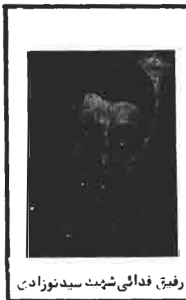
رفیق فدائی شهید سید نوزادین