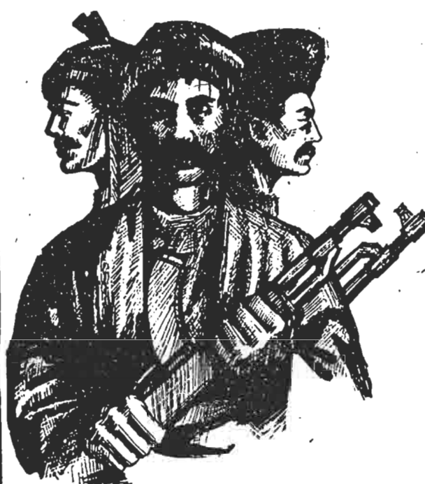
خلق مبارز کرد، در کنار سایر خلقهای دلاور ایران برای صلحی عادلانه و ایرانی آزاد و دمکراتیک مبارزه می‌کنند تا لحظه‌های عشق و صلح و آزادی را به ارمغان آورند.

در اطراف سنندج جنگ هنوز ادامه دارد، در طول شب نیز درگیری‌ها در شهر شدت می‌یابد. مردم شهر به ویژه زنان از تفتیش خانه‌ها به وسیله پاسداران جلوگیری می‌کنند.