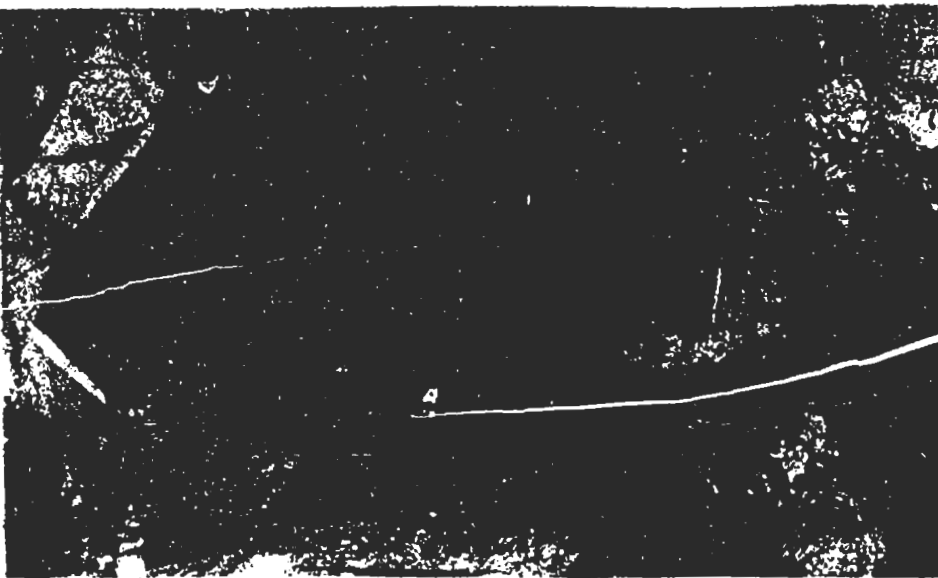
جنگ تحمیلی اخیر بر خلق دلاور کرد، برای مردم رزمنده آن ویرانگری‌های بی‌شماری را به دنبال داشته است. در معصومیت نگاه کودکان گزده درخشانی موج می‌زند. در زیر این خانه‌های چادری کودکانی بزرگ می‌شوند که درس مبارزه را می‌آموزند.

شدند. به دنبال آن سهر توسط پادگان به توپ و خمپاره بسته شد.