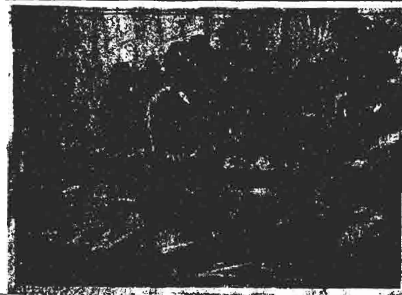
در فلسطین ، هر خانه ، اداره ، مدرسه و هرکجای نقطه این خاک ، سنگری است برای مبارزه . عکس ، رزمندگان جوان را در حال آموختن اسلحه نشان می دهد که آتش گلوله های آن قلب محتضر امپریالیسم امریکا را نشانه گرفته است .

خلق برای آزادی فلسطین در مصاحبه های بعد از شرح سیاست های صهیونیست ها می گوید : این سیاست های مستعمراتی نه تنها با منافع طبقه کارگر بلکه همچنین با منافع دهقانان خرده بورژوازی ، متخصصین و غیره و حتی بخش هایی