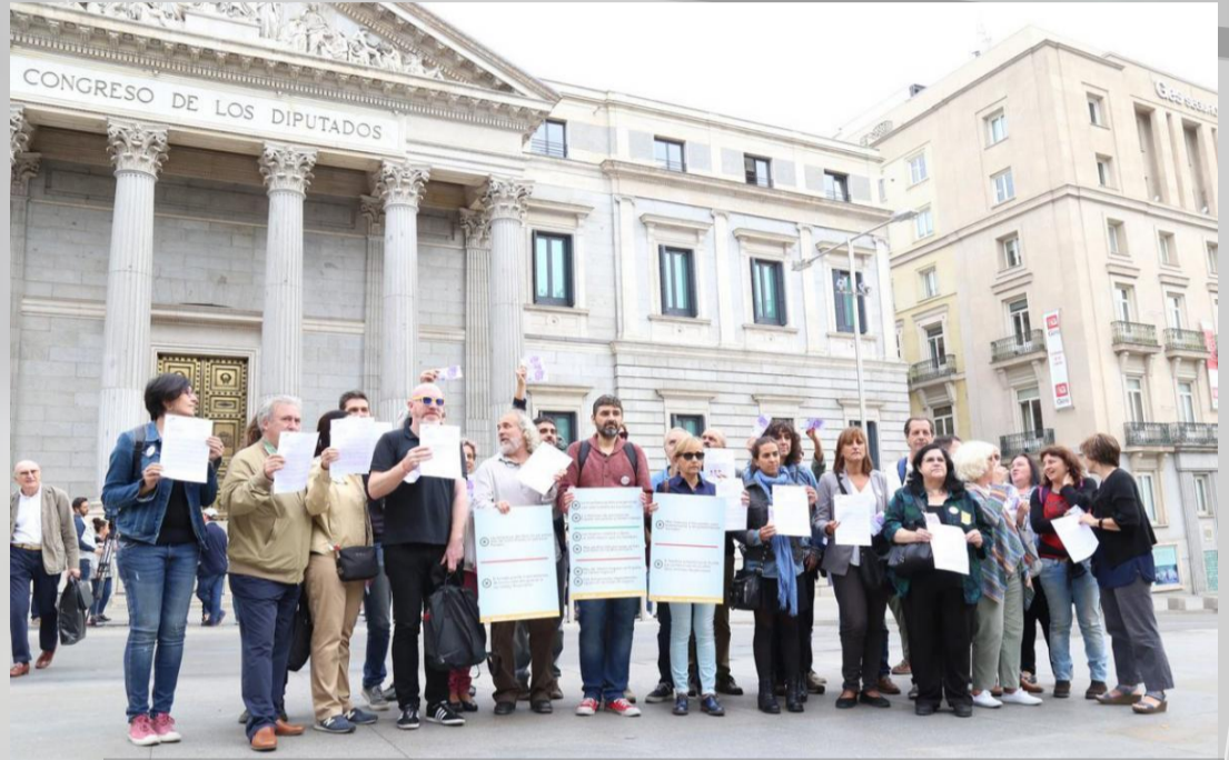
کمیسیون های کارگری به اتفاق انجمن های حقوق بشر برای ارائه و ثبت پیشنهادها، برای مبارزه با فقر در مقابل پارلمان اسپانیا

اداره آمار اروپا (یورواستات) به اسپانیا به عنوان یکی از کشورهای که فقر در آن از سال ۲۰۰۸ افزایش یافته است، اشاره دارد، در حالی که فقر در اتحادیه اروپا است ۳ دهم درصد از سال ۲۰۰۸ کاهش داشته است، اما در اسپانیا فقر با افزایش ۴٫۱ درصد را نشان می دهد.