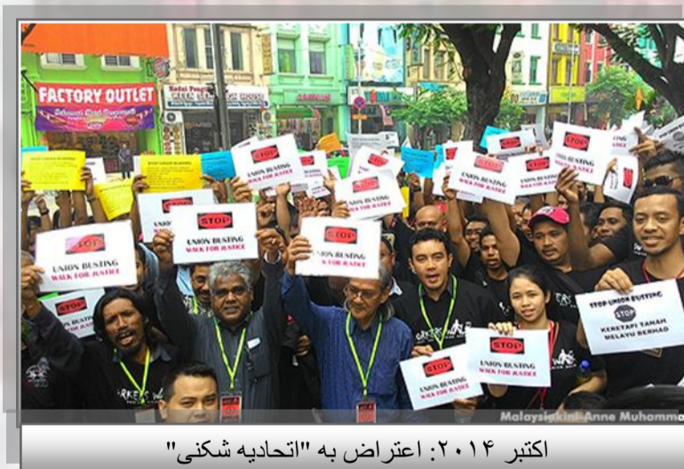
اکتبر ۲۰۱۴: اعتراض به "اتحادیه شکنی"

ناکیه راماسامی دانشگاه پوترا - مالزی ترجمه: گودرز