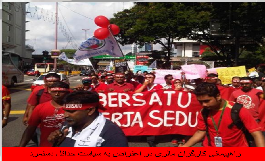
راهپیمائی کارگران مالزی در اعتراض به سیاست حداقل دستمزد